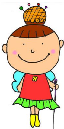
イメージキャラ クラフトさん